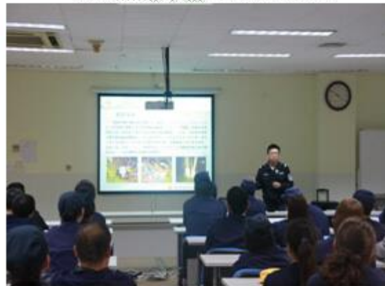
深入厂企宣讲交通安全知识