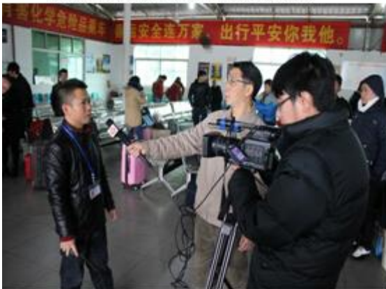
采访制作交通安全宣传新闻