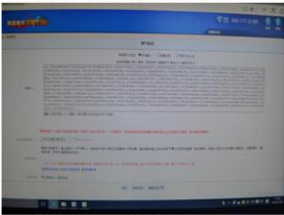
交警发送交通安全宣传短信