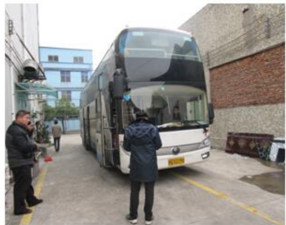
图为执法人员检查富邦配客点现场

获，涉嫌大型客车客运包车招揽包车合同外旅客乘车，车上的20名乘客分别从广东药学院中山分校、电子科技大学中山学院上车前往深圳，每人需支付车费50元钱，在对司机与乘客进行调查取证后，执法人员证据保存了该车的道路运输证。