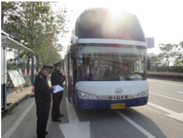
图为执法人员在中江高速港口入口处执法

在2月4日上午，中江高速港口入口处，分局查获一台粤T35960大客车，该车已经是春运期间第二次被港口交通分局查