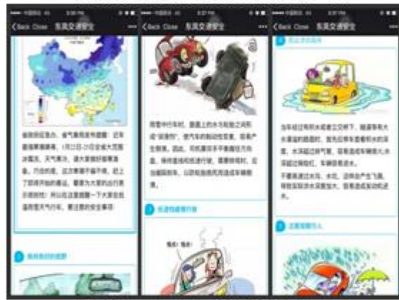
利用微信平台推送交通信息