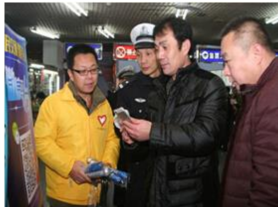
宣教民警讲解交通安全知识