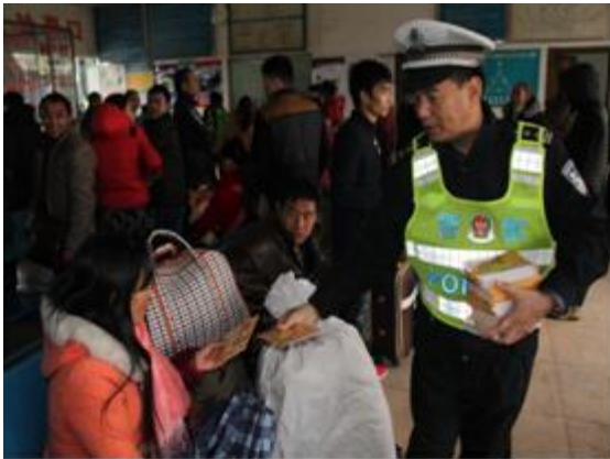
民警在候车室派发宣传资料