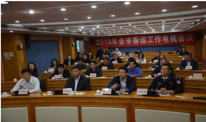
图：2018 年春运电视电话会议

2018 年春运从 2 月 1 日开始至 3 月 12 日结束，共计 40 天。