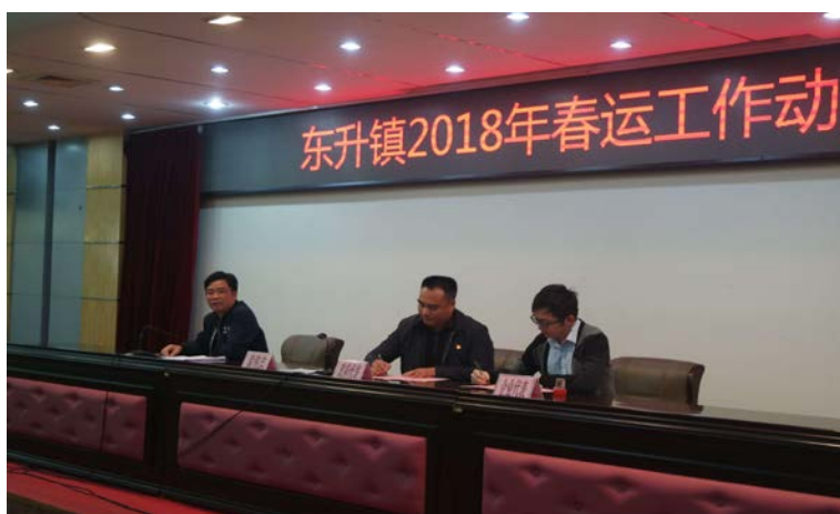
图：东升镇 2018 年春运工作会议

2018 年 1 月 24 日下午，收看全市的春运工作电视会议后，东升镇立即召开了“东升镇 2018 年春运工作动员会议”，全面部署春运工作，为广大人民群众提供强有力的交通运输保障和优质贴心服务作充分准备。